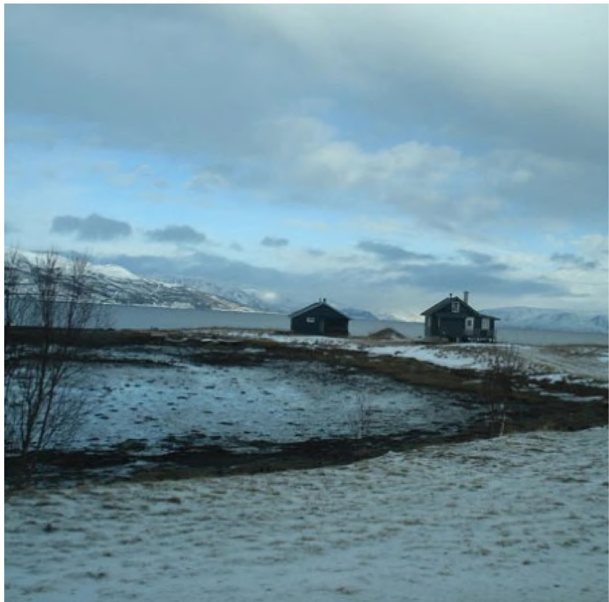
פינמרק, צפון נורבגיה

תמיד תמהתי על הדימוי הרווח של אנשי מדע כמי שהאמת מצויה בכיסם, כמי שמתהלכים שאננים בעולם ומביטים בעליונות על המוני הפלבאים מתחניהם, השקועים עדיין בביצת האמונות הטפלות. דבר לא רחוק יותר מהמציאות שמוכרת לי, כמי שעוסק במדע ובא במגע עם אנשים שבחרו בקריירה דומה. החוויה הבסיסית בעולם הזה היא חוויה של ספק, של ערעור על אמיתות מקובלות. בכל שבוע, בכל יום, אדם שעוסק במדע נפגש לפחות בחמש טענות או תיאוריות שהוכחו כשגויות. רק לעתים נדירות הוא או היא זוכים לחוויה ההפוכה – התוודעות לאמת, האמת לאמיתה. הטעות היא ברירת המחדל, היא האוויר שאנו נושמים והמזון שאנו לועסים שוב ושוב. רוב שעות הערות שלנו מוקדשות לגיטוש עיקש ובלתי פוסק בתוך סבך של טעויות, בניסיון נואש למצוא נתיב אחד שלא יסתיים גם הוא במפח נפש.