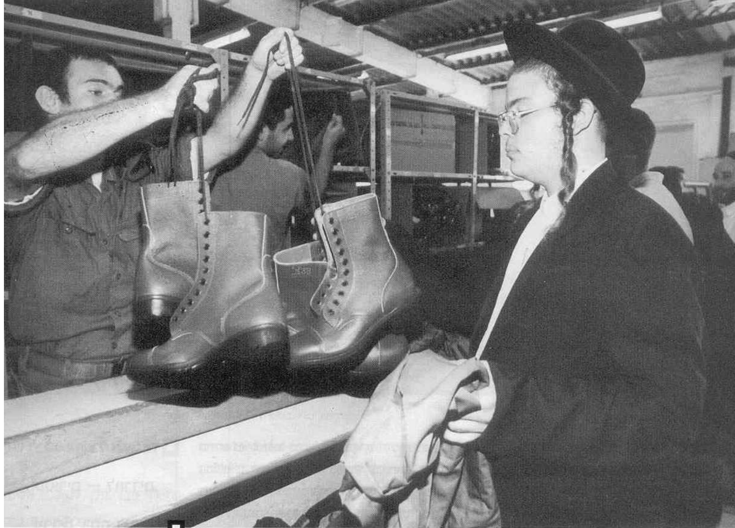
לא חזון אחרית הימים — גיוס הנח"ל החרדי

כל מדינה דמוקרטית חייבת להכיר גם בזכויות של קבוצות מיעוט שבתוכה ולאפשר לאנשיה לחיות על פי השקפתם; אין היא חייבת, כמובן, להעניק להם טובות הנאה בשל כך