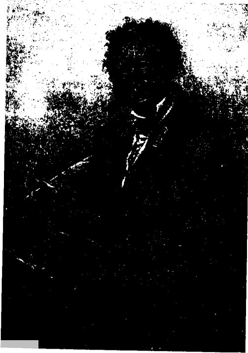
מרדכי עמנואל נח (1785-1851)