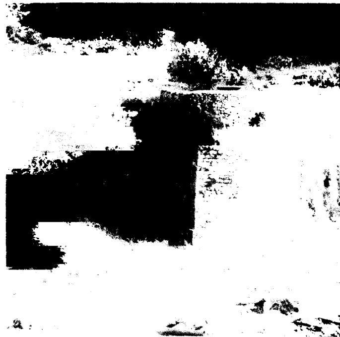
טחנת הקמח של עין זיו