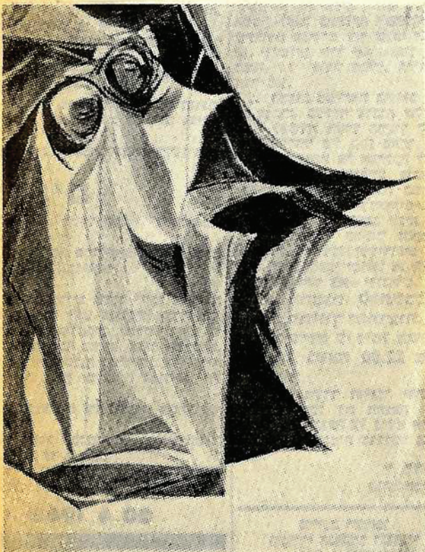
אודרי ברגנר: שתי נשים בשוחה