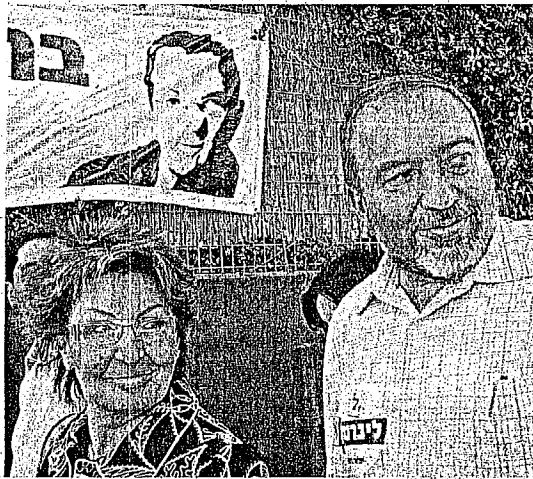
Софа Ландвер и Авиадор Либерман

Мы пытаемся бороться за спасение KAMEA. Нас поддерживают самые авторитетные израильские коллеги - в том числе председатель всеизраиль-